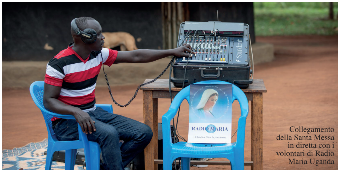
Collegamento della Santa Messa in diretta con i volontari di Radio Maria Uganda

ARGENTINA GUATEMALA BOLIVIA MEXICO BRAZIL NICARAGUA CANADA PANAMA CANADA (Italian) PARAGUAY CHILE PERU COLOMBIA URUGUAY COSTA RICA USA DOMINICAN REP. USA - (Italian) ECUADOR USA - (Spanish) EL SALVADOR VENEZUELA