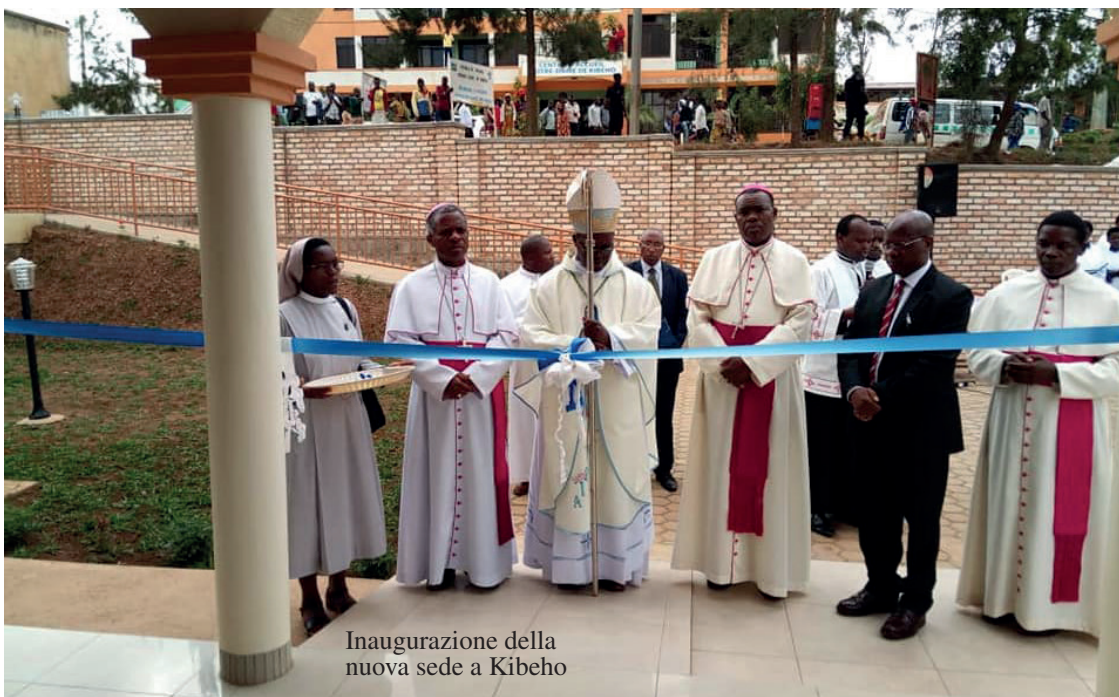
Inaugurazione della nuova sede a Kibeho